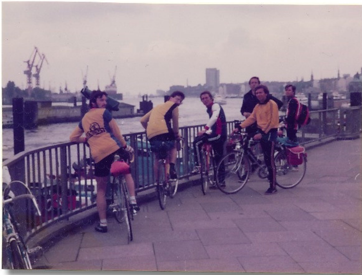
Hamburg ist erreicht ....