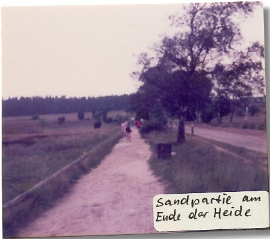
Sandpartie am Ende der Heide