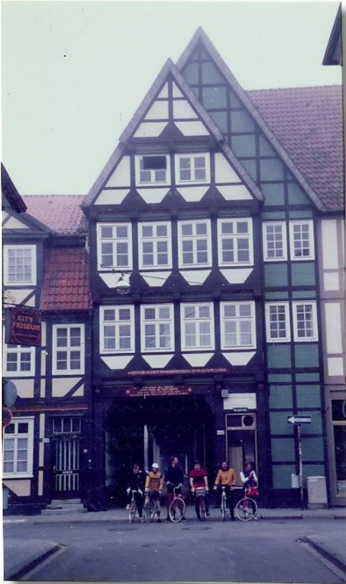
Abfahrt von Celle bei Rauhreif