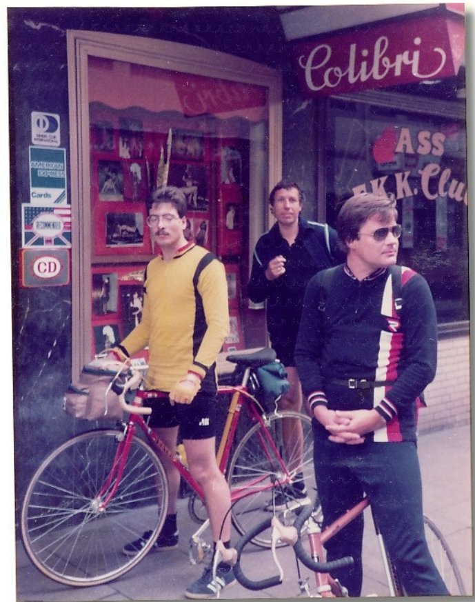
Betet für uns und steh uns bei