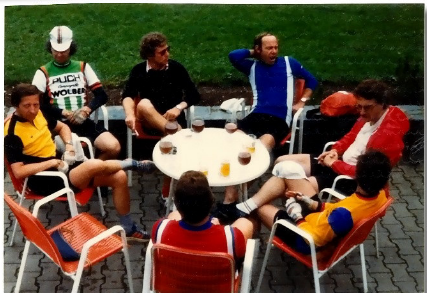
MATERIAL sitzt herum