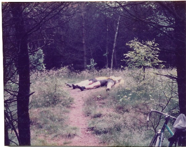
Hünen an ihren Gräbern