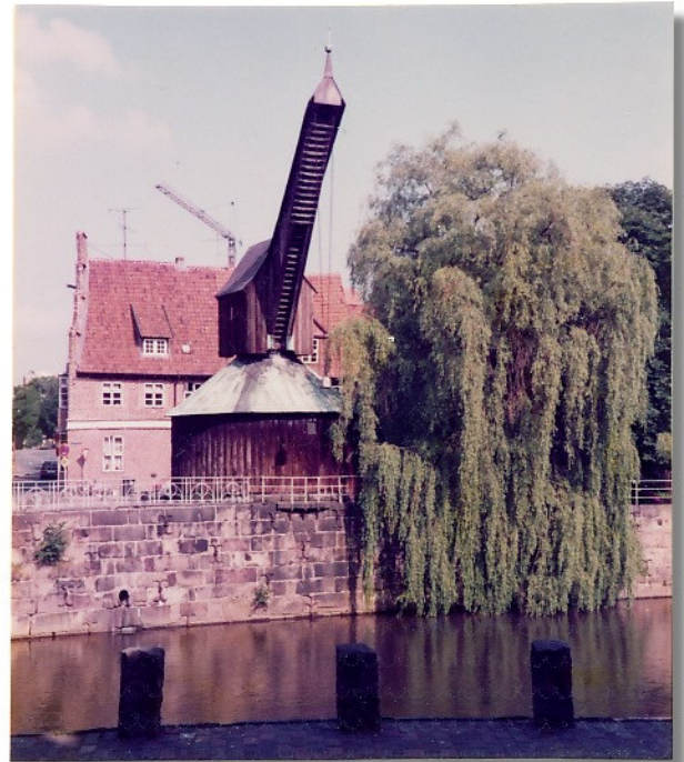
Romantische Ecke, wo abends das Bier schmeckt.