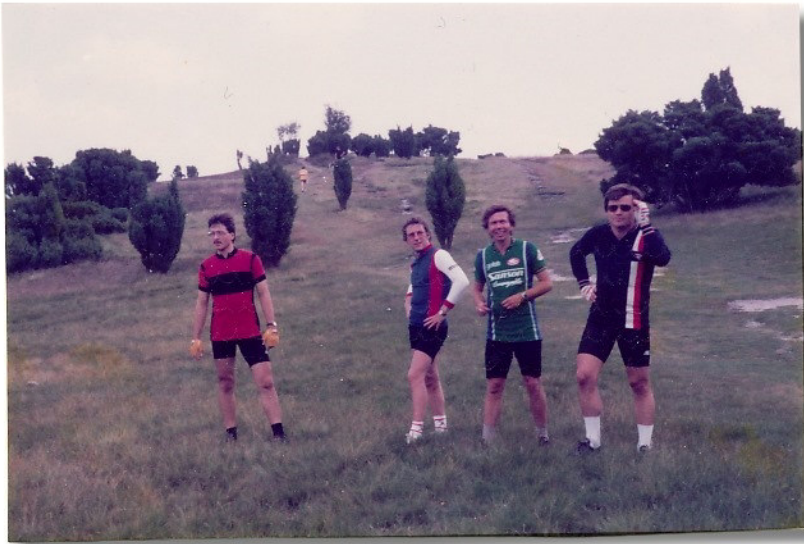
Höchster Punkt Norddeutschlands