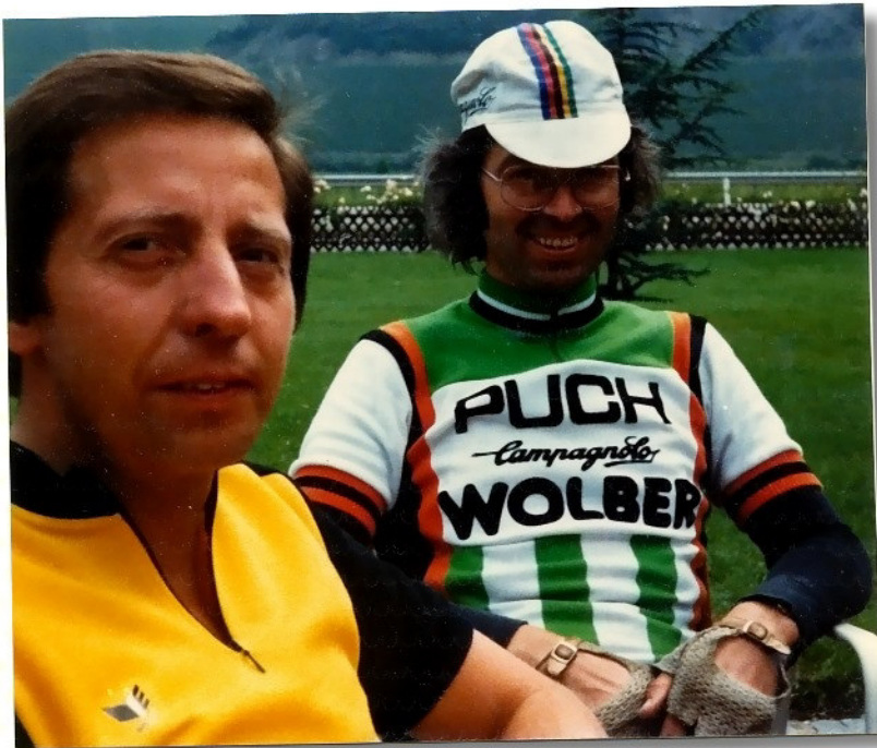
Reklame ist das halbe Profi-Leben