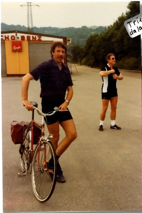
Trier ist erreicht da lachen die Römer