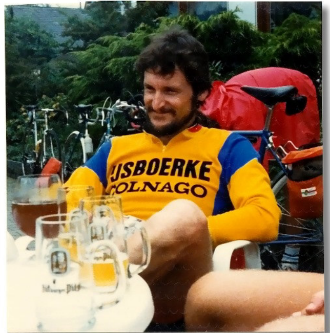
2. Tag letzte Rast vor Trier