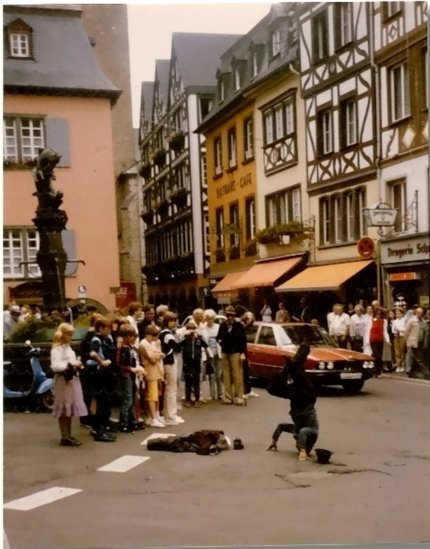
In Cochem ist was los