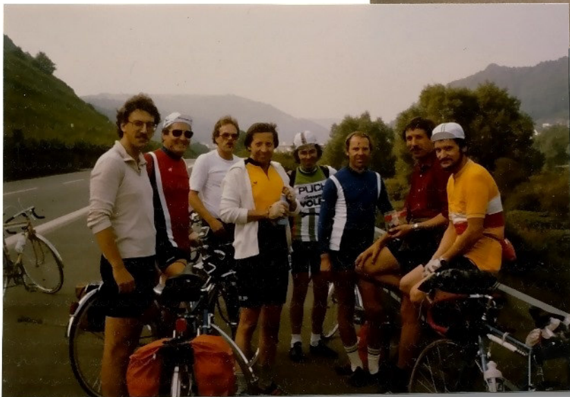
Nach den 1. Pannen der Mosel lang