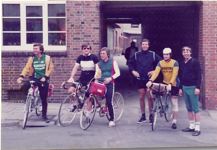
Herren mit Dame v. der Abfahrt