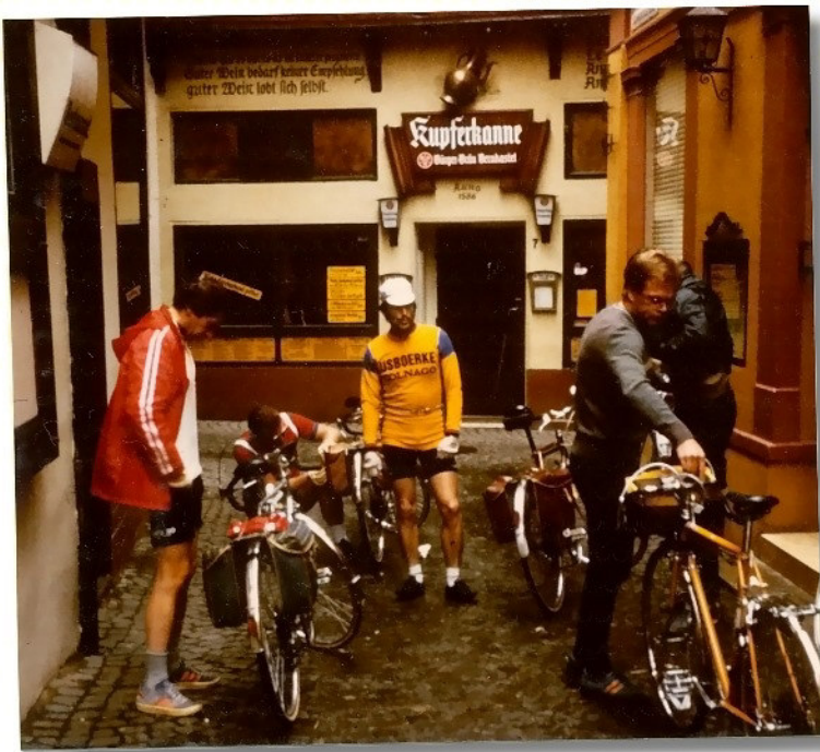
Jede Wirtschaft wird angesteuert