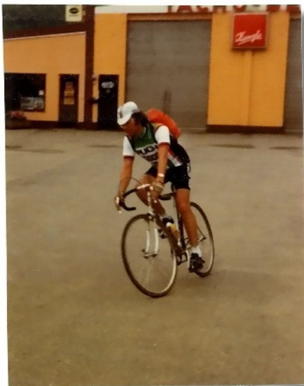
Rückfahrt mit dem Zug