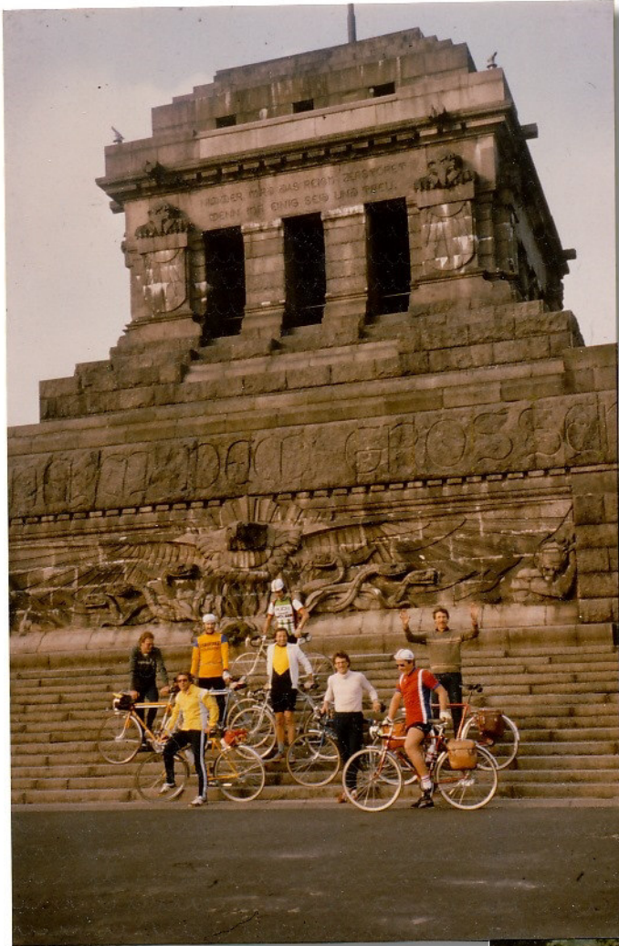
Abfahrt Koblenz Deutsches Eck