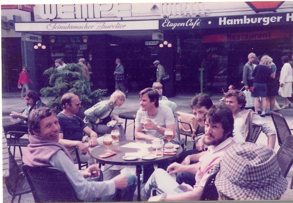
Letzte Stärkung vor der St. Pauli-Tour