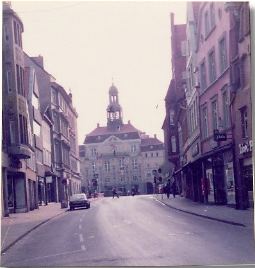
Das Rathaus von Lüneburg