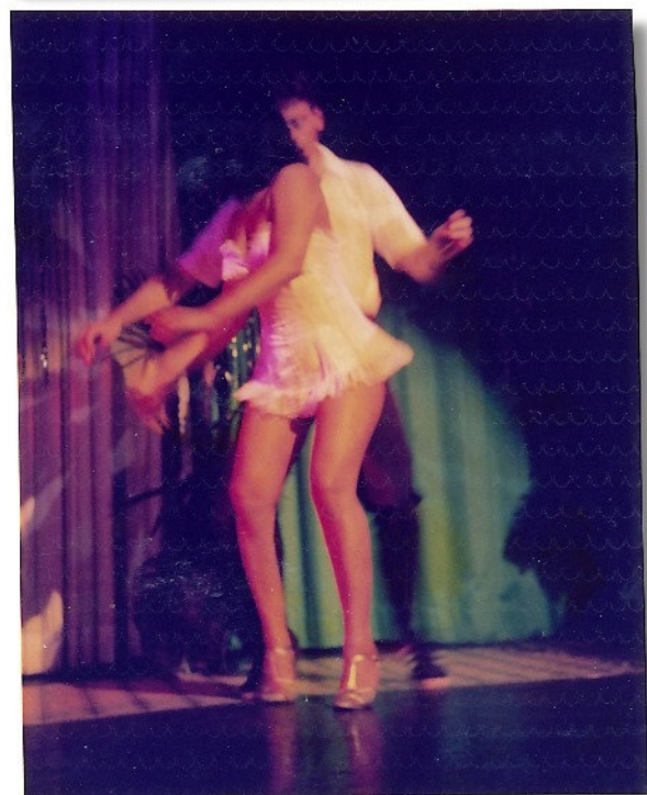
Nachmittags müde und abends wird Samba getanzt.