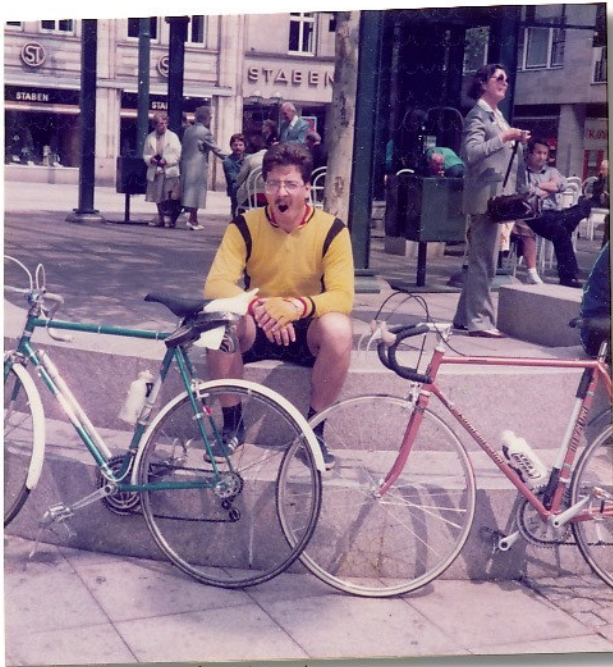
Müde aber zu allem bereit.