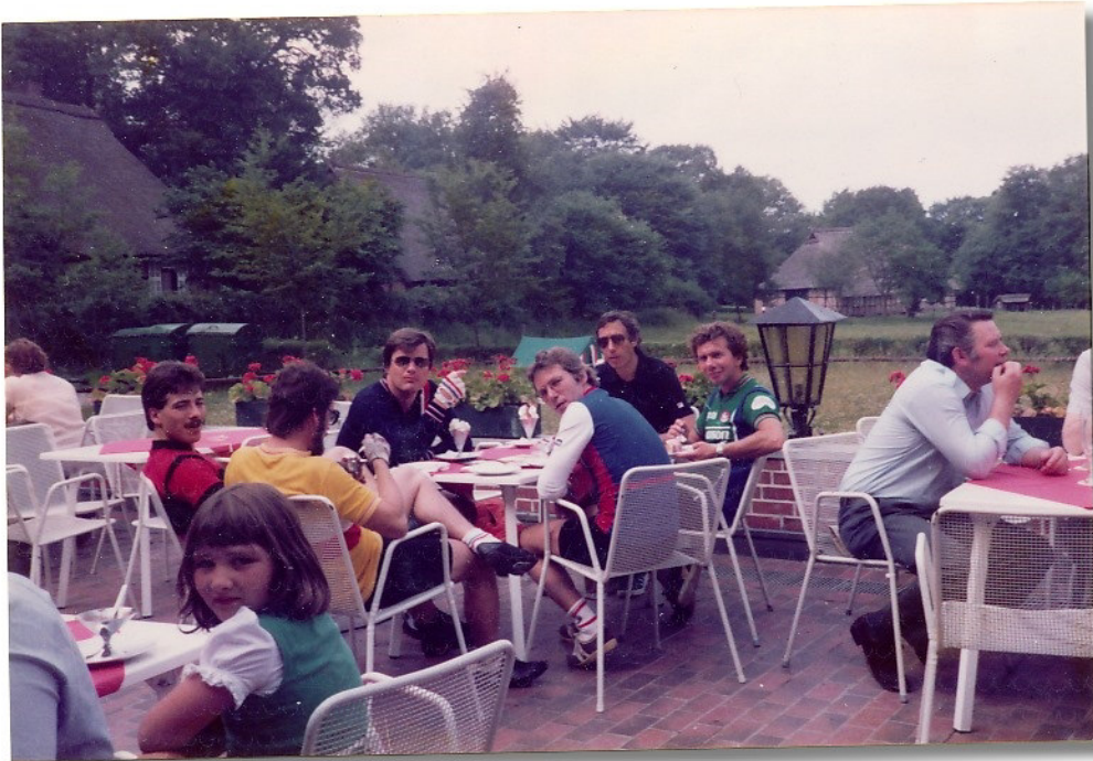
In Wilsede beim Eisbecher