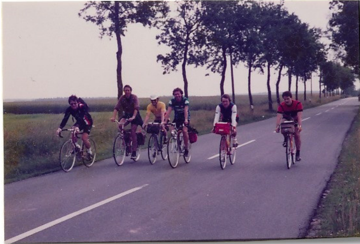
Fahrt Richtung Nordheide